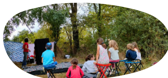
Découverte du clown pour une dizaine d'enfants autour d'un atelier d'initiation