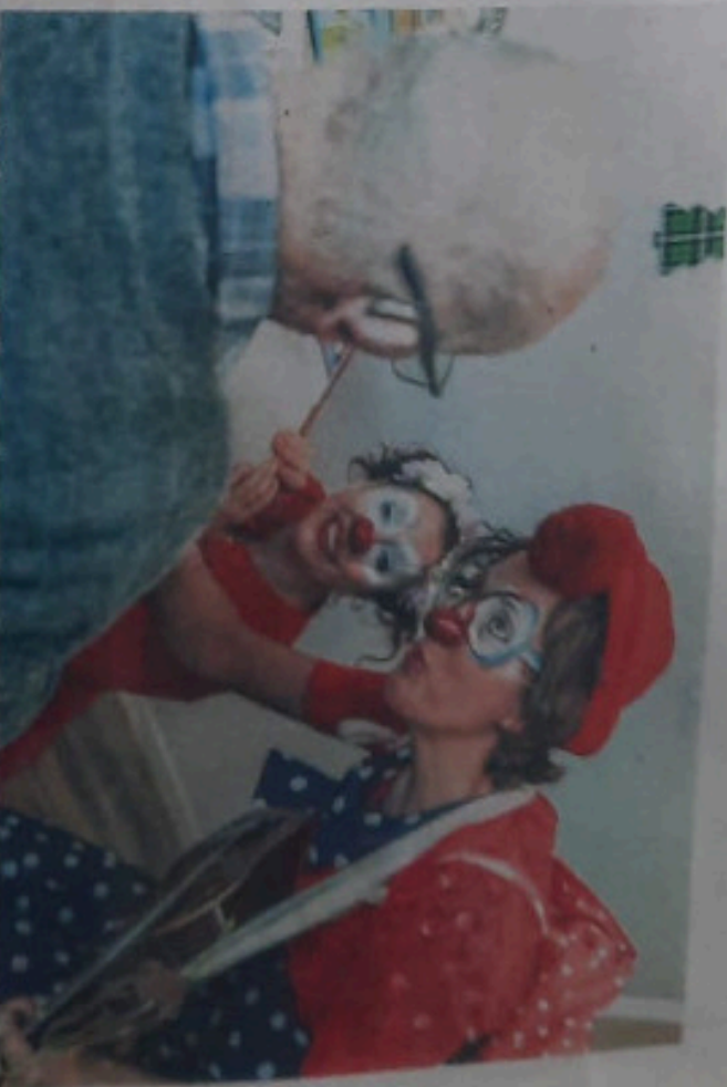
Avec des instruments, des chants ou de la musique, les clowns d'« Un grain de folie » cherchent à changer les idées et à réveiller des émotions chez les personnes âgées, seules, malades ou en fin de vie. Un grand de folie

L'autre défi dans lequel l'association s'est lancée, c'est sa connaissance auprès du grand public. Une connaissance qui est encore assez confidentielle. « On a donc eu l'idée de faire une soirée gratuite qui commencera par des petites saynètes pour faire comprendre ce que l'on fait. Au lieu de l'expliquer, on va le jouer,