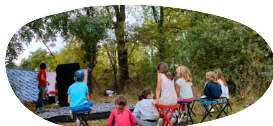
Découverte du clown pour une dizaine d'enfants autour d'un atelier d'initiation