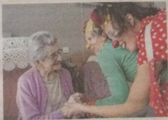
Les deux clowns interviennent dans trois maisons de retraite. Un grain de folie

■ Un grain de folie, contact : 07 83 28 09 56 ou 1graindefolie.contact@gmail.com. Renseignements sur www.1graindefolie.fr